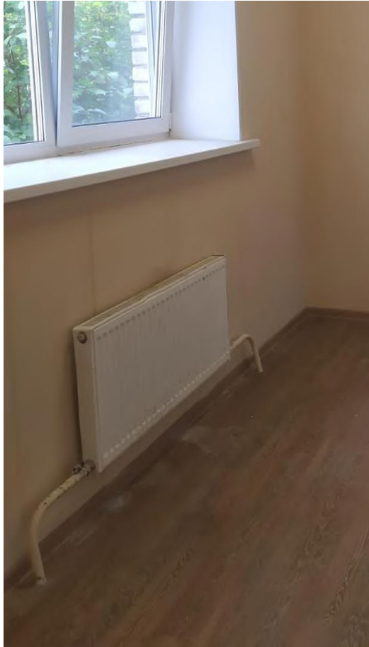
Рис. 6 Подтеки под окном