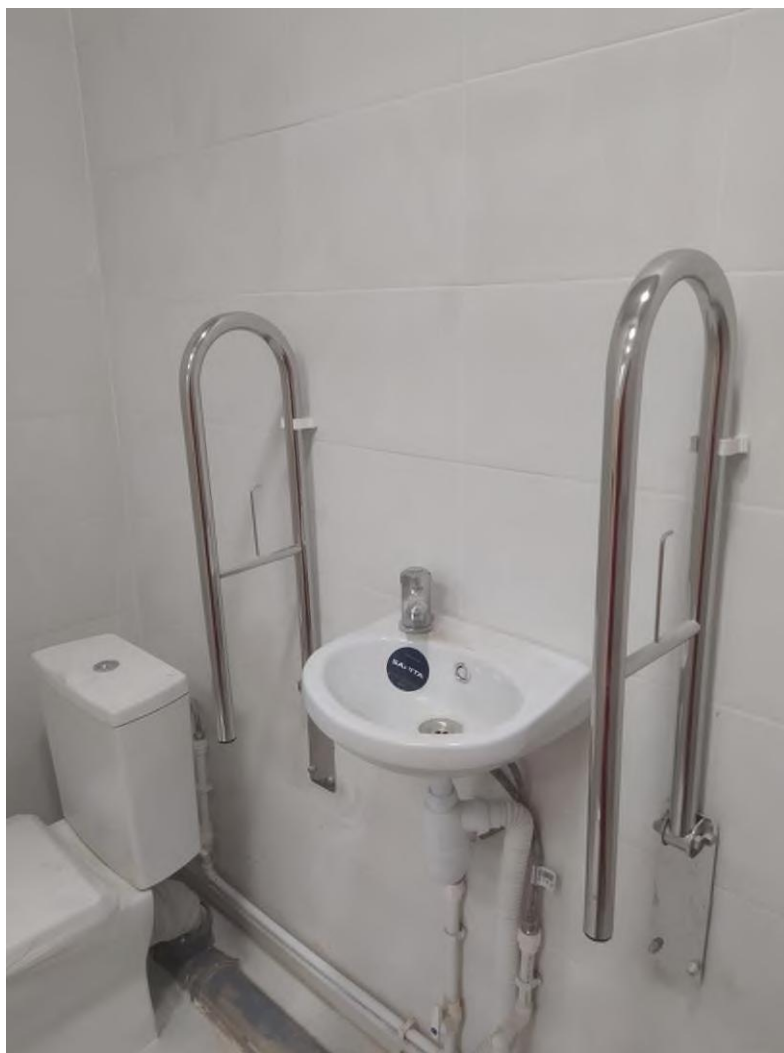
Рис. 5 Высокая раковина

- образование конденсата на окнах и подтеков под окнами. Фотофиксация установки окон, откосов и подоконников отсутствует. Оценить качество выполненных скрытых работ невозможно. При этом подтеки под окнами и вокруг подоконника следствие нарушения технологии производства работ, при этом возможные причинами послужили плохо утепленные откосы, некорректный монтаж утеплителя или герметизация швов, некачественное установление отлива. Для определения причины протекания окон учреждению необходимо обратиться к специалисту и в дальнейшем пригласить подрядчика для устранения недостатков по гарантии (рис. 6, рис. 7, рис. 8).