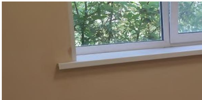
Рис. 7 Подтеки по откосам