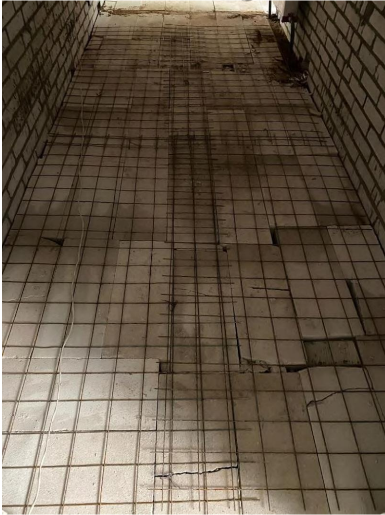
Рис. 2 Подготовка армирования для стяжки пола без гидроизоляции