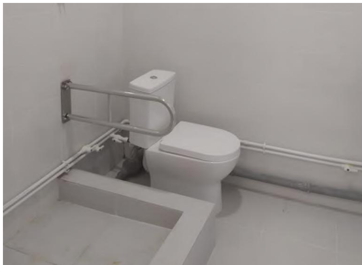
Рис. 4 Поручень для унитаза