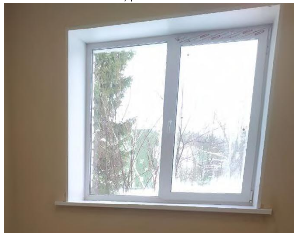
Рис. 8 Конденсат на окнах

- сметой не предусмотрена полная облицовка крыльца плиткой, в связи с чем будет происходить постепенное разрушение крыльца (рис. 9);