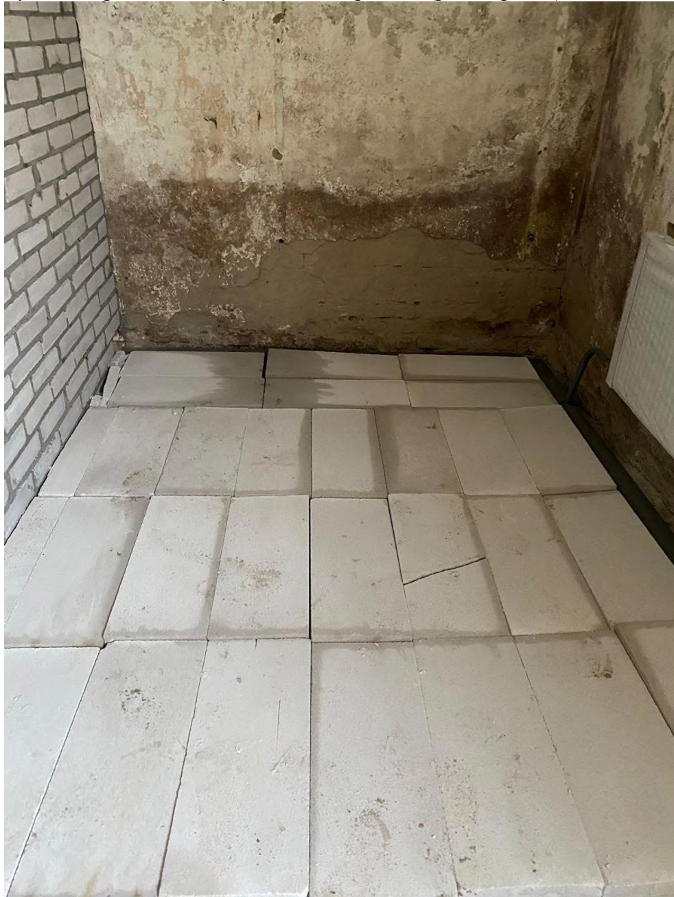
Рис. 1 Хаотичная укладка блоков, без выровненного основания и скрепления

полимерной мембраной или просто толстым полиэтиленом в два слоя, который не позволял бы влаге из стяжки впитываться в утеплительную прослойку пола. В связи с чем, нельзя гарантировать отсутствие трещин в полу с течением времени (рис. 1, рис. 2);